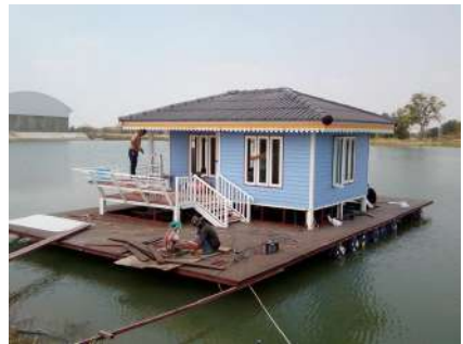
บ้านเรือนแพ