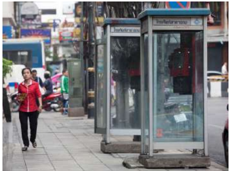
ตู้โทรศัพท์สาธารณะ