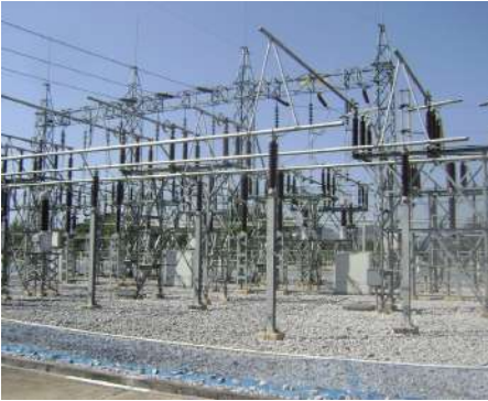
ลานโกไฟฟ้า