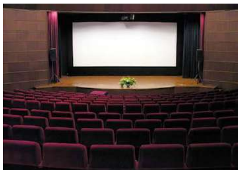
โรงมหรสพ