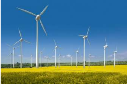
กังหันลม

ตัวอย่างสิ่งปลูกสร้างที่อยู่ในข่ายได้รับการยกเว้นภาษี