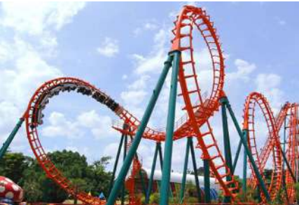
เครื่องเล่นในสวนสนุก