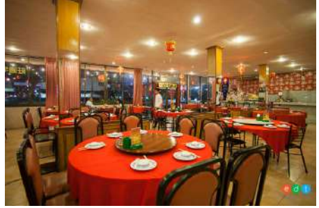
ภัตตาคาร