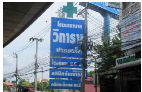
ตัวอย่างป้ายที่ต้องเสียภาษี

หากในกรณีที่ไม่มีผู้มาขึ้นแบบแสดงรายการภาษีป้าย หรือเจ้าหน้าที่ไม่สามารถติดต่อหรือหาตัวเจ้าของป้ายได้ ให้ถือว่าผู้ครอบครองป้ายมีหน้าที่เสียภาษีป้าย แต่ถ้าหาตัวผู้ครอบครองป้ายไม่ได้ เจ้าของหรือผู้ครอบครองที่ดินที่ติดตั้งป้ายจะต้องเป็นผู้เสียภาษีป้ายแทน ตามลำดับที่กล่าวมา