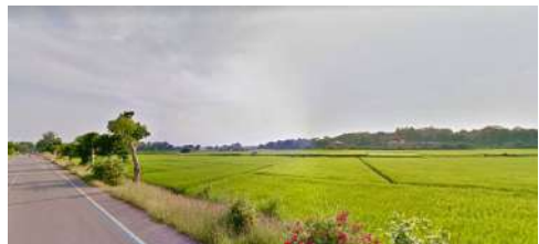
ที่ดินที่ใช้ทำกิจกรรม