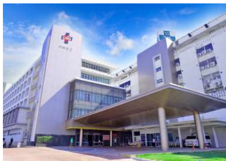
สถานพยาบาล