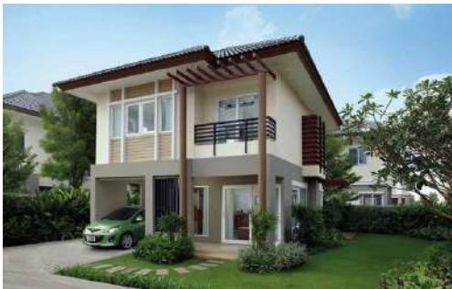
บ้านเดี่ยว