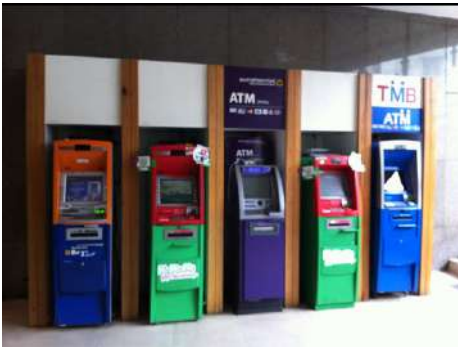
ตู้ฝากถอนเงินสด