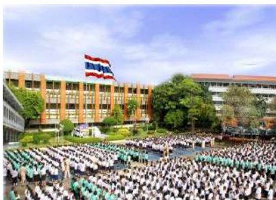
สถานศึกษา