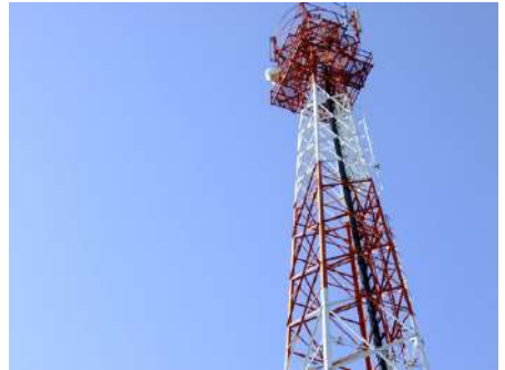
เสาส่งสัญญาณอินเทอร์เน็ต