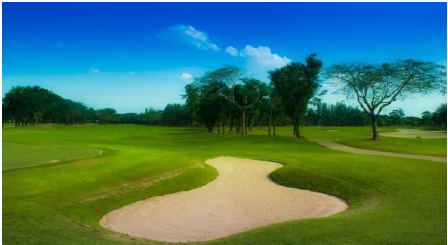
สนามกอล์ฟ จัดเป็นธุรกิจการกีฬา จึงได้รับการลดภาษี

1.4 ลดภาษีร้อยละ 90 ของจำนวนภาษีที่จะต้องเสียของทรัพย์สินที่ใช้เป็นสถานที่เล่นกีฬา สวนสัตว์ สวนสนุก หรือที่จอดรถสาธารณะ