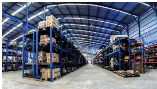
คลังสินค้า