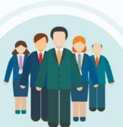
ผู้ประกอบการ นักธุรกิจ