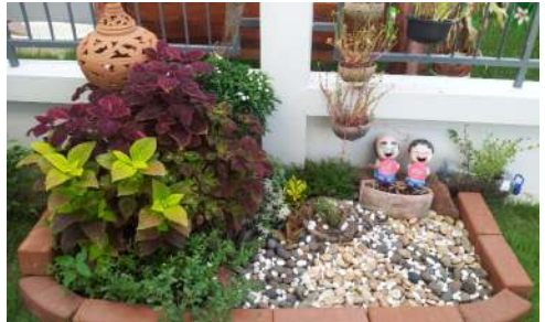
สวนหย่อม