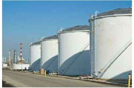
ถังเก็บน้ำมันบนดิน