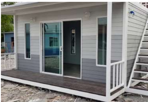
บ้านประกอบเสร็จ