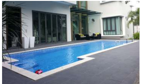
สระว่ายน้ำ