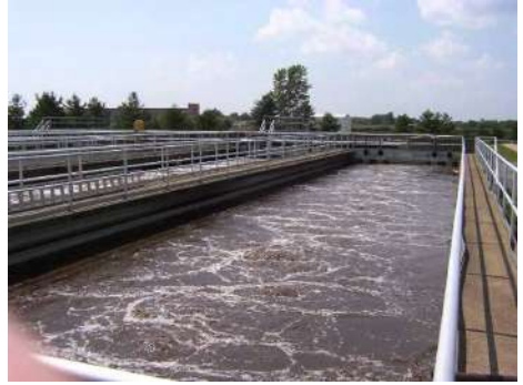
บ่อบำบัดน้ำเสีย