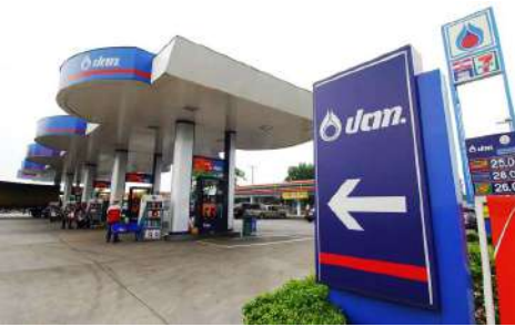
สถานีบริการน้ำมัน