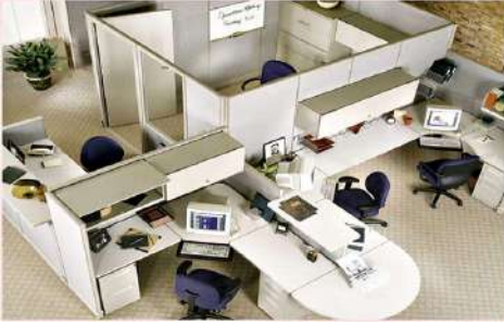
สำนักงาน