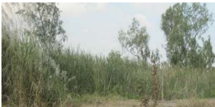
ที่ดินรกร้างไม่ได้ใช้ประโยชน์

(2) ที่ดินที่ไม่เป็นกรรมสิทธิ์ของบุคคลธรรมดาหรือนิติบุคคล แต่อยู่ในความครอบครองของบุคคลธรรมดาหรือนิติบุคคล เช่น สปก. 4, ก.ส.น., ส.ค.1, นค.1, นค.3 ส.ท.ก.1 ก, ส.ท.ก.2 ก, นส.2 (ใบจอง) และที่ดินอันเป็นทรัพย์สินของรัฐ ซึ่งมีการเข้าไปครอบครองหรือทำประโยชน์ ฯลฯ เป็นต้น