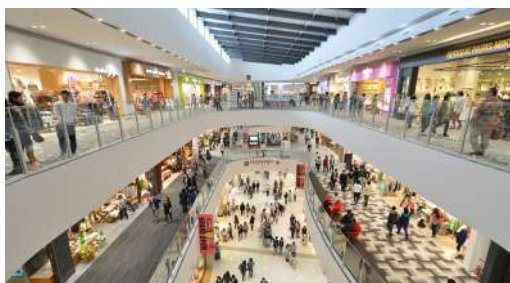
ห้างสรรพสินค้า