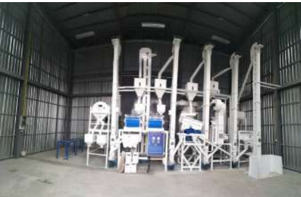
โรงสีข้าว