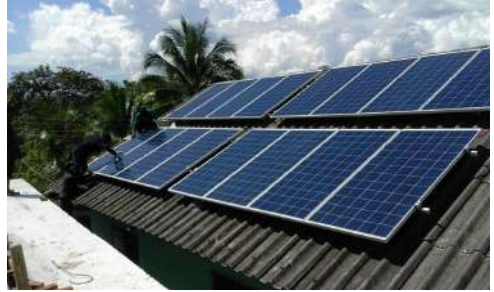
แผงโซลาเซลล์