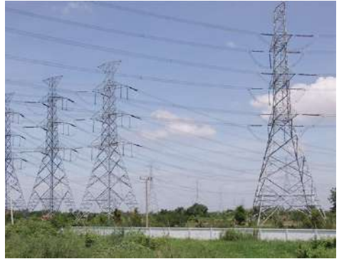
เสาไฟฟ้า