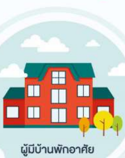
ผู้มีบ้านพักอาศัย