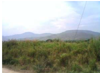
ที่ดินที่ทิ้งไว้ว่างเปล่าหรือไม่ได้ทำประโยชน์ตามควรแก่สภาพ